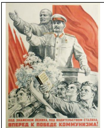
Надпись: Вперед к победе коммунизма!