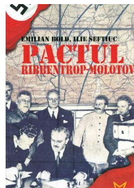
Надпись: Пакт Риббентропа-Молотова