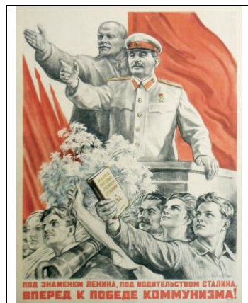
Надпись: Вперед к победе коммунизма!