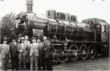
Паровоз «Король Фердинанд», завод Решица, Румыния, 1926