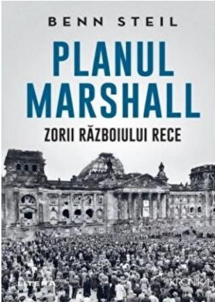
Надпись: План Маршалла. Рассвет холодной войны.