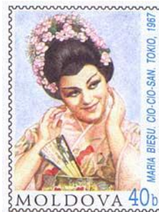
Inscripție: Maria Bieșu, Cio-Cio-San, Tokio, 1967