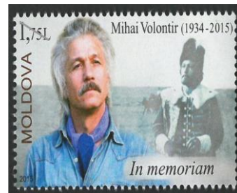
Timbru poștal din Republica Moldova