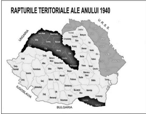
Территориальные потери 1940 года